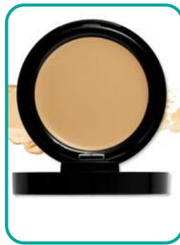
Concealer-cremig 20.- CHF