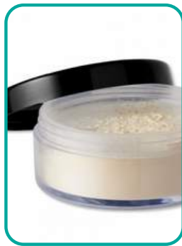
Loose Mineral Puder 28.- CHF