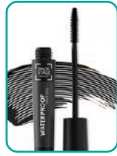
Waterproof Mascara 24.-CHF