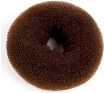
Donutkissen braun / blond Durchmesser 14cm je 11.-CHF