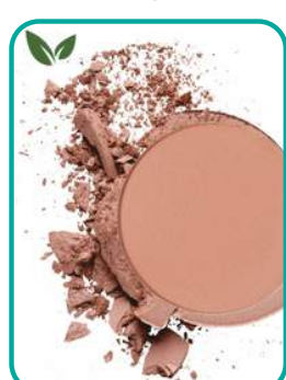
17-LovelyBerry 22.- CHF