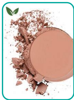
47-CoralTouch 22.- CHF