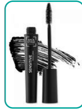
Sensitive Mascara 24.-CHF