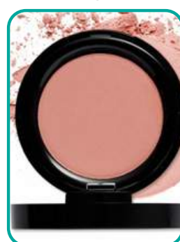
46-FlowerPower 22.- CHF