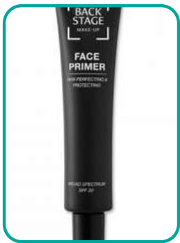
Face Primer 38.- CHF