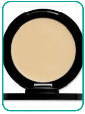
Eyeshadow Primer 22.-CHF