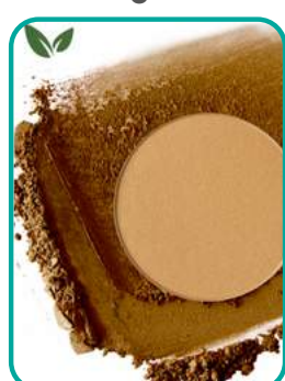
Bronzer-GoldenHour 25.- CHF