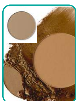
Contour-Intense /Soft 22.- CHF