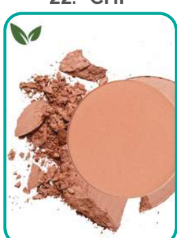
18-ApricotCheeks 22.- CHF