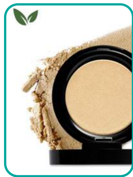
Highlighter Holychampagne 22.- CHF