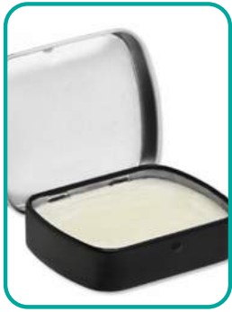
Brow Butter 17.-CHF