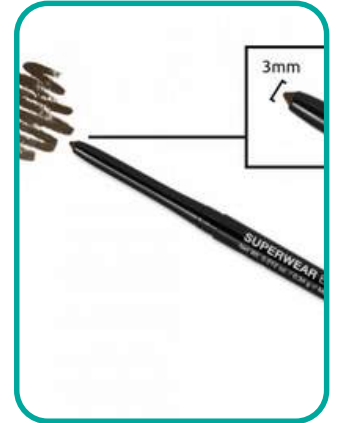
Eyepencil braun oder schwarz je 13.-CHF