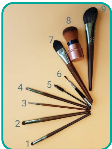
Starter Make-up Pinsel 9-teilig 150.-CHF

Eyeliner, 15.- xq22-schräger Pinsel (Lidstrich & Brauen), 15.- Lippenpinsel togo, 10.- 20-Lidschatten, 25.- 14- Blender, 25.- 104 Foundation- Concealer, 25.- Puder Pinsel togo, 15.- Rouge Pinsel, 25.- Wimpern-& Brauenbürste