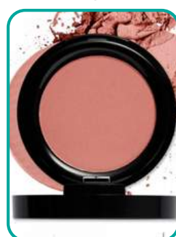
44-TastyGrenadine 22.- CHF