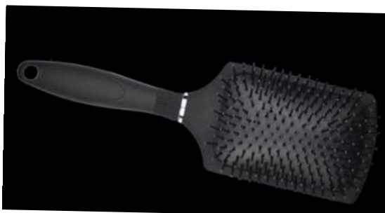
Paddlebrush 27x8cm 25- CHF