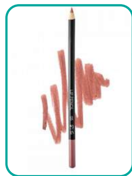
Lipliner-05-Rusty 12.- CHF