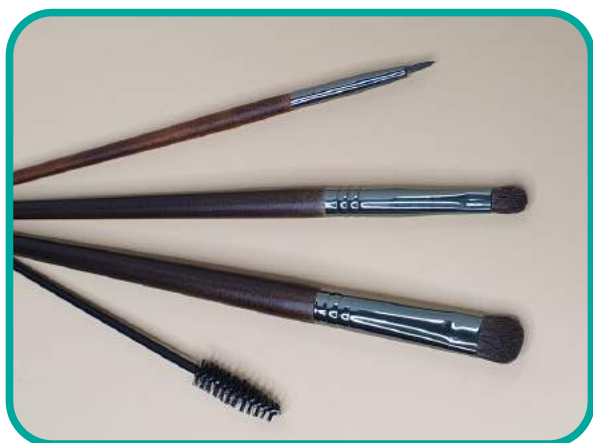
Augen Makeup Pinsel Set 65.-CHF

10-Eyeliner, 15.- 20-Lidschatten, 25.- 14- Blender, 25.- Wimpern-& Brauenbürste