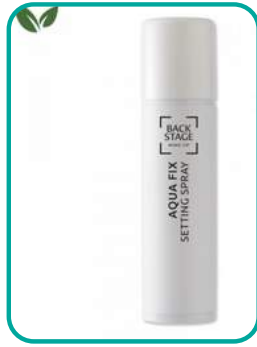
Setting Spray 16.-CHF