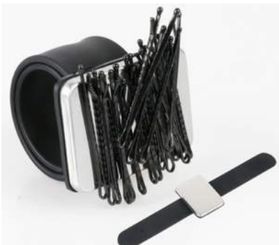
Magnetarmband 13.- CHF